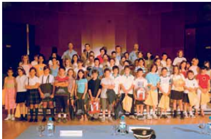
Los premiados junto a la Concejal de Educación, el Concejal de Seguridad y Tráfico y el Jefe de Policía Local.