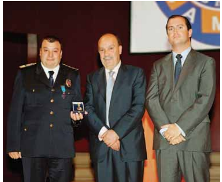
En la imagen, el Alcalde junto al Concejal de Seguridad y el Jefe de SAMER-Protección Civil