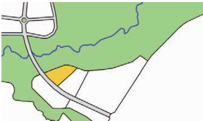
En amarillo, la parcela en El Cantizal.

El Ayuntamiento de Las Rozas ha puesto a disposición de la Comunidad de Madrid dos parcelas municipales para la construcción de dos nuevos Centros Docentes.